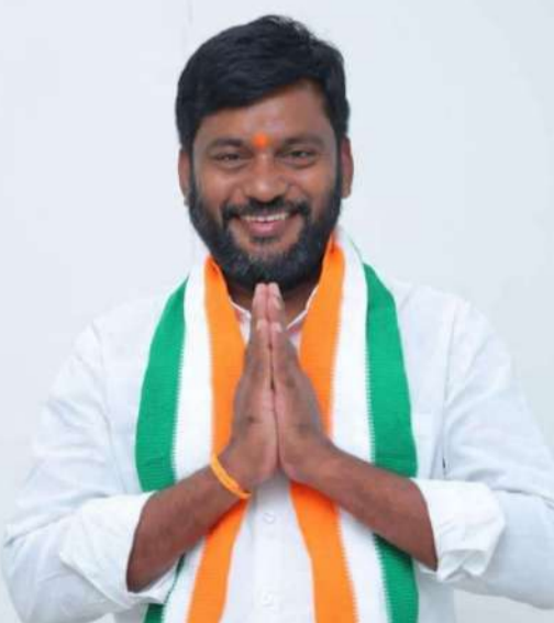
ఒక్కరు సహజ మరణం పొందిన ఆ కుటుంబానికి ప్రభుత్వం 5 లక్షల రూపాయల ఇందిరమ్మ బీమా పథకం అనారాగా నిలిచి భీమా మొత్తాన్ని అందజేస్తుందని చెప్పారు. అదేవిధంగా ప్రైవేట్ నుండి ఇంటర్నెట్ యిల్ వరకు విద్యార్థులకు అభ్యాసకం అందించడానికి బడ్జెట్ నిధుల కేటా యింపు జరిగిందని, మూడు రోజులపాటు పాటు, మరో మూడు రోజుల పాటు రాగిజాపను విద్యార్థులకు అందించి రక్షణాపత్రం నుండి విద్యార్థులను