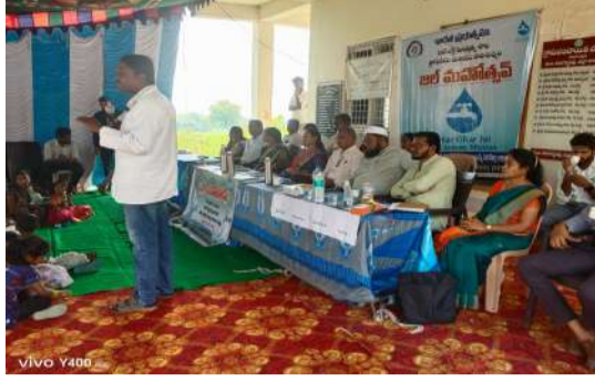
ద్వారా గ్రామంలో నీటి వినియోగంపై బాధ్యత పెరిగి, వర్షావరణ పరిరక్షణకు బలమైన పునాది పడుతుందని గ్రామ పెద్దలు ఆశాభావం వ్యక్తం చేశారు. ఈ కార్యక్రమం మల్లాపూర్ గ్రామాన్ని ఆదర్శ గ్రామంగా నిలబెట్టే దిశగా కీలక అడుగుగా మారింది.