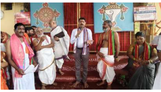
ఎంతో భక్తిశ్రద్ధలతో చేస్తున్నారని ఆనాడు ఆ రామదాసుచూపిన బాటలో నడుస్తూ రామదాసు భక్తి మండలి వారు హిందూ సంప్రదాయాన్ని కాపాడుతున్నారని కొనియాడారు కార్యక్రమంలో వేద పండితులు ఆలయ అధికారులు రామదాసు భక్త మండలి కోటి కోటి తలంబ్రాలు దీక్ష సభ్యులు సుమారు 400 మంది