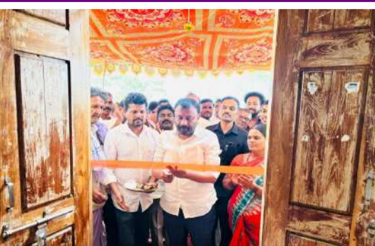
మన ప్రజావాణి జులూపల్లి ఆర్ సీ ప్రతినిధి మార్చి 15: కామారెడ్డి జిల్లా పెద్ద