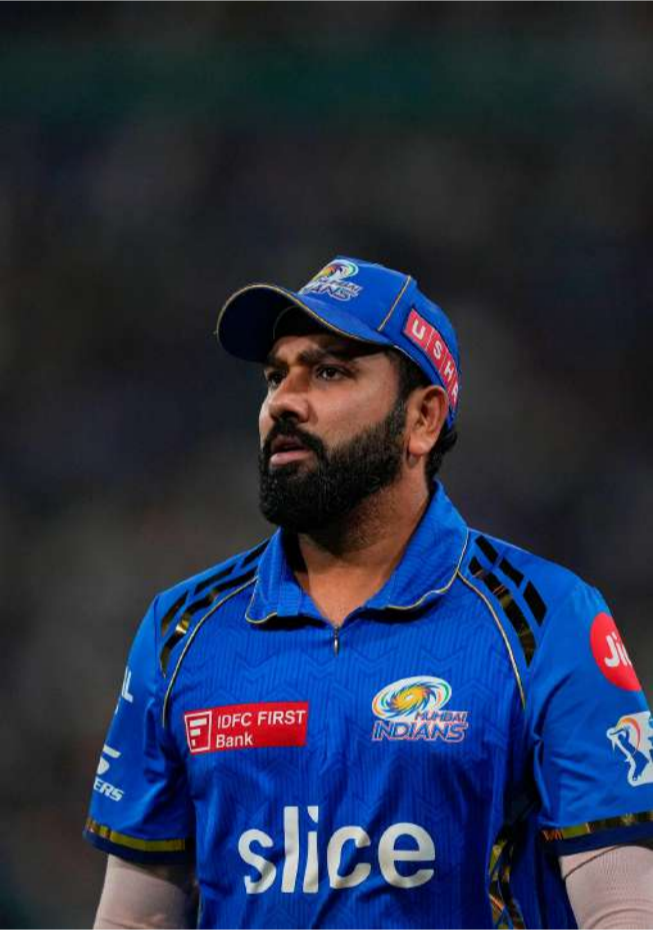
2026 సీజన్ మార్చి 28న ప్రారంభం కానుంది. తొలి మ్యాచ్ లో రాయల్ ఛాంబర్స్ బెంగళూరు - నన్రెజెస్ట్ హైదరాబాద్ జట్టు తలపడనున్నాయి. ముంబై ఇండియన్స్ తమ తొలి మ్యాచ్ ను మార్చి 29న మూడు సార్లు ఛాంపియన్ కోల్కతా నైట్ రైడర్స్ జట్టుతో ఆడనుంది.