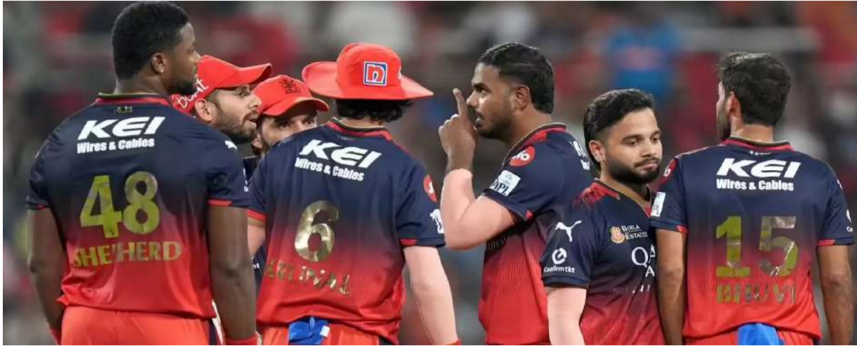
ఆర్జీశ్ అమ్మకంపై హాట్ టాపిక్.. 2 జలియన్ దాలర్లకు భారీ డీల్, రేసులో కొత్త కంపెనీ!