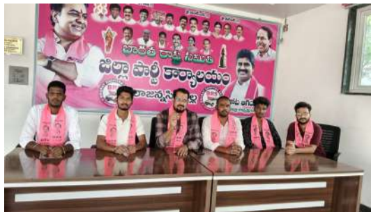
చేసిందని అన్నారు. ఆనాటి తెలంగాణ తొలి ముఖ్యమంత్రి కేసీఆర్ ఆర్టీసీని అభివృద్ధి చేసి కార్మికులకు అందగా నిలిచిన