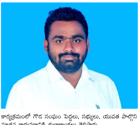
కార్యక్రమంలో గౌడ సంఘం పెద్దలు, సభ్యులు, యువత పాల్గొని నూతన కార్యవర్గానికి శుభాకాంక్షలు తెలిపారు.