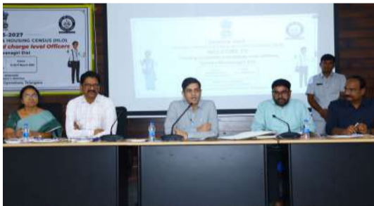
సెన్సస్ ఆపరేషన్ రెండు విధాలుగా ఉంటుందని డాక్టర్ ముఖ్య పాత్ర చార్జ్ అధికారులదేనని అన్నారు. ఈసారి జరగనున్న జనాభా గణనను దేశంలో తొలిసారిగా డిజిటల్ విధానంలో నిర్వహించ నున్నారని, మొత్తం యాపిలు, వెబ్ పోర్టల్లను ఉపయోగించి గణన ప్రక్రియను నిర్వహించనున్నట్లు తెలిపారు. అదే విధంగా సెన్సస్ డిజిటల్ గా మారి పోయిందని క్రియేషన్ చేసుకోవడం చాలా సులభ కరంగా ఉంటుందని, ఎవరి మొత్తం ఫోన్ల వారి సొంతంగా అప్డేట్ చేసుకోవాలని సర్వే చేయవచ్చని అన్నారు. ప్రజలు తమ వివరాలను తామే స్వయంగా ఆన్లైన్ ద్వారా నమోదు చేసుకునేందుకు ప్రత్యేక పోర్టల్లను గణన ప్రారంభానికి ముందు అందుబాటులో ఉంచనున్నట్లు స్పష్ట చేశారు. మొదటి దశలో నిర్వహించే ఇళ్ల జాబితా, గృహాల గణనలో ఇంటి నిర్మాణానికి ఉపయోగించిన పదార్థాలు, ఇంటి