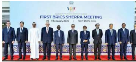
న్యూఢిల్లీ, మార్చి 15: భారత్ యుద్ధంపై బ్రిక్స్ ఏకాభిప్రాయం సాధించలేక పోయింది. సంయుక్త ప్రకటనను విడుదల చేయడంలో విఫలమైంది. కొన్ని సభ్యదేశాలు మిగతావే...

● కొన్ని సభ్యదేశాలు భాగస్వాములుగా ఉండడమే కారణం : విదేశాంగ శాఖ