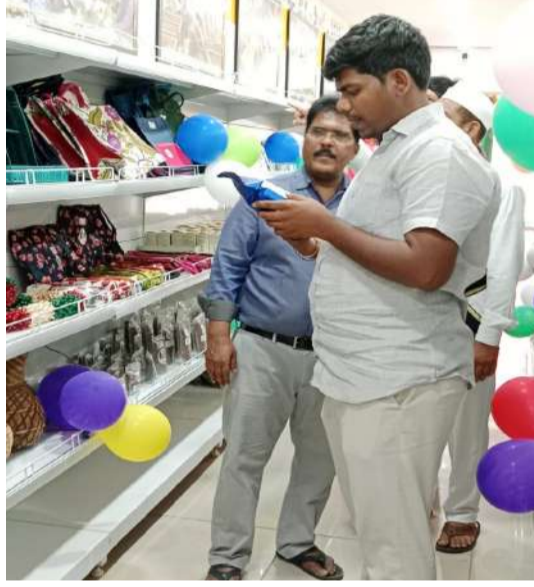
ఈ కార్యక్రమంలో సహాయ ప్రాజెక్టు అధికారి జనరల్ డేవిడ్

భద్రాచలం/మన ప్రజావాణి (మార్చి 27): భద్రాచలం పట్టణం ప్రజలకు, ఆదివాసి గిరిజన గ్రామాలలోని ప్రజలకు గిరిజన మహిళలు స్వతహాగా తయారు చేసే పోషకాహారమైన ఆహార సహజాలతో పాటు, ఆర్గానిక్ సంబంధించిన నిత్యవసర సరుకులు సరఫరా అందించడానికి భద్రాచలం పట్టణంలో నెలకొల్పిన భద్రగిరి మార్ట్ శనివారం రోజు తెలంగాణ రాష్ట్ర గవర్నర్ శివ ప్రతాప్ శుక్ల చేతుల మీదుగా ప్రారంభిస్తున్నట్లు ఐడిపీ ప్రాజెక్టు అధికారి బి. రాహుల్ అన్నారు. శుక్రవారం రోజు సాయంత్రం యూనిటీ అధికారులతో కలిసి భద్రగిరి మార్ట్ ను ఆయన సందర్శించి, గిరి మార్ట్ లో నిత్యవసర సరుకులను, ఆర్గానిక్ సంబంధించిన వివిధ రకాల సామాన్లను పరిశీలించిన అనంతరం, ఆయన మాట్లాడుతూ పూర్తిస్థాయి ఆర్గానిక్ వ్యవసాయ ఉత్పత్తులు, అటవీ ఉత్పత్తులు, సేంద్రీయ ఎరువులతో పండించిన ఉత్పత్తులు, ఎస్. హెచ్. జి గ్రామ్ మహిళలు తయారుచేసిన నాణ్యత గల ఇతర పదార్థాలు సరఫరా చేసే ధర్మలకు ప్రజలకు అందించడానికి భద్రగిరి మార్ట్ ను ప్రారంభిస్తున్నామని, ఈ సువర్ణ అవకాశాన్ని గిరిజన గ్రామాలలోని ప్రజలు పట్టణ ప్రజలు అధిక సంఖ్యలో భద్రగిరి మార్ట్ ను సందర్శించి ఆరోగ్యకరమైన మీకు సచ్చిన వస్తువులను కొనుగోలు చేసి గిరిజనలకు చేయూత అందించాలని ఆయన అన్నారు.