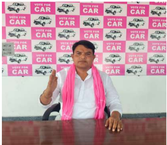
పార్టీ తీరుపై ముస్సాబాద్ మండల కేంద్రంలో మెంగని మనోహర్

ముస్సాబాద్ /ప్రజావాణి :ఉద్యోగాలు ఇవ్వకపోగా, కేసీఆర్ హయాం లో ఇచ్చినవి తామిచ్చామని కాంగ్రెస్ దుష్ప్రచారం చేసి విషయాన్ని తీవ్రంగా బి ఆర్ ఎస్ పార్టీ రాష్ట్ర నాయకులు మెంగని మనోహర్ తీవ్రంగా ఖండించారు. అబద్ధపు ప్రచారాలు చేస్తున్న కాంగ్రెస్