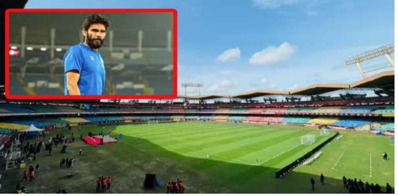
జరుగుతుందని హామీ ఇచ్చింది. కొచ్చి స్టేడియంలో కొత్తేమీ కాదు.. కలూలా, స్టేయర్ లోలిన్ బోర్స్ లను మీడియా గడిని ఖాళీ చేయాలని ఆదేశించి వివాదానికి తెరలేపారు. దాదాపు 10 ఏళ్ల తర్వాత కొచ్చిలో ఓ అంతర్జాతీయ ఫుట్ బాల్ మ్యాచ్ జరుగుతున్న తరుణంలో ఇలాంటి నిర్వహణ లోపాలు కాన్ఫరెన్స్ సమయంలో కూడా కోట్ డేవిడ్

అడ్డుకున్నారు. (ఫైనల్ కాన్ఫరెన్స్) రద్దుగురువారం మధ్యాహ్నం 3 గంటలకు జరగాల్సిన ఈ అధికారిక విలేకరుల సమావేశం, అధికారుల నిర్ణయం వల్ల చివరి నిమిషంలో రద్దయింది. అటగాళ్లను గేటు వద్దే నిలిపివేయడంపై అభిమానులు మండిపడడం దుతు న్నారు. భారత ఫుట్ బాల్ చరిత్రలో 13 ఏళ్ల తర్వాత ఒక స్టేడియం లో సారథ్యంలో జట్టు ఆడుతున్న క్రమంలో ఇలాంటి ఘటన జరగడం గమనార్హం. ఈ వివాదంపై ఆల్ ఇండియా ఫుట్ బాల్ ఫెడరేషన్ సోషల్ మీడియా వేదికగా స్పందించింది. స్టేడియం అప్పగించే ప్రక్రియలో కొన్ని పరిపాలనాపరమైన అడ్డుకులు ఎదురైన మాట వాస్తవమేనని.. అయితే మ్యాచ్ నిర్వహణకు ఎటువంటి ముప్పు లేదని స్పష్టం చేసింది. మార్చి 29 నాటికి స్టేడియం పూర్తిగా తమ నియంత్రణలోకి వస్తుందని.. షెడ్యూల్ ప్రకారం మార్చి 31న రాత్రి 7 గంటలకు మ్యాచ్