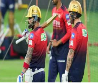
మ్యాచ్ పేరే టికెట్లకు బదులుగా క్యూఆర్ కోడ్ ఆధారిత టికెట్లను కొనుగోలు చేయాలి ఉంటుంది. టికెట్లు ఉన్న వారికి మెట్ల ప్రయాణం ఉచితం. అభిమానుల కోసం అయిదు ప్రదేశాలలో పార్కింగ్ కల్పించారు. అక్కడి నుంచి బస్సుల ద్వారా స్టేడియానికి చేరవచ్చు. స్టేడియం చుట్టూ అదనంగా 50 సీసీటీవీ కెమెరాల ద్వారా నిరంతరం నిఘా ఉంచారు. ఐపీఎల్ ఏర్పాట్లపై కర్ణాటక క్రికెట్ అసోసియేషన్ అధ్యక్షుడు, మాజీ క్రికెటర్ వెంకటేశ్ ప్రసాద్ ఈ ఉదయం ముఖ్యమంత్రి