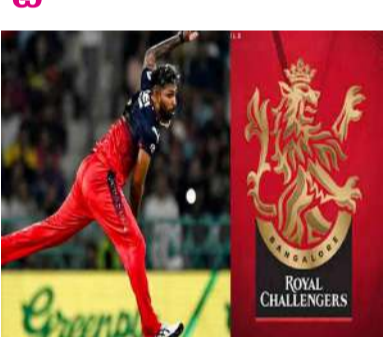
సందేహాలు నెలకొన్నాయి. ఫిట్ నెస్ నిరూపించుకున్నాకే లంక క్రికెట్ బోర్డు ఇటీవల ఫిట్ నెస్ ప్రమాణాల విషయంలో కొత్త నిబంధనలు ప్రవేశపెట్టింది. ఎవరైనా సరే ఫిట్ నెస్ నిరూపించుకున్నాకే విదేశీ లీగ్స్, టైమ్స్ కు సింగిల్ ఆడేందుకు అనుమతి లభిస్తుంది. తుషార విషయానికొస్తే ఈ మధ్య గాయం వడలేదు. బోర్ని చేసేందుకు అతడు సిద్ధంగా ఉన్నాడు. కానీ, లంక బోర్డు నిర్దేశించిన ఫిట్ నెస్ ప్రమాణాలను అందుకోవడంలో మనోడు విఫలమయ్యాడు.

ఐపీఎల్ ఆరంభానికి ముందే పలు ప్రాంత వైజులకు పరుగులు షాకెలు తగులుతున్నాయి. పలు జట్లకు చెందిన కీలక అటగాళ్లు గాయాలతో బోర్ని నుంచి వైదొలిగారు. రాయల్ ఛాలెంజర్స్ బెంగళూరు సైతం అదే పరిస్థితి ఎదుర్కొంటోంది. ప్రధాన పేసర్ జోష్ హేజిల్ వుడ్ కోన్ని మ్యాచ్ లకు దూరం కానుండగా.. మరో విదేశీ పేసర్ సైతం ఐపీఎల్ ఆడడంపై సందేహాలు నెలకొన్నాయి. శ్రీలంక అటగాడు సువాన్ తుషార కు ఆ దేశ బోర్డు నో అడ్మిషన్ సర్టిఫికేట్ ఇవ్వకపోవడమే అందుకు కారణం. వంతోమ్మిడ్ సీజన్లో ఆర్గీబీని పేసర్లు కొరత వెంటాడుతోంది. గాయం నుంచి కోలుకుంటున్న ప్రధాన పేసర్ జోష్ హేజిల్ వుడ్ కోన్ని మ్యాచ్ లకు దూరం కానుండగా.. కేనుల్ సువాన్ తుషార కు దయాల్ పై ప్రాంత వైజు వేట వేసింది. ఈ పరిస్థితుల్లో మరో పేసర్ సువాన్ తుషార మెగా బోర్నిలో ఆడడంపై ఇంకా స్పష్టత లేదు. శ్రీలంక బోర్డు ఆతడికి ఇంకా నో అడ్మిషన్ సర్టిఫికేట్ ఇవ్వలేదు. దాంతో, తుషార ఈ సీజన్ కు అందుబాటులో ఉండడంపై