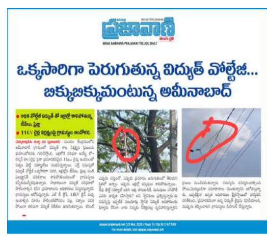
చేయడం పట్ల హర్షం వ్యక్తం చేస్తున్నారు. చాలా కాలంగా

చెన్నారావుపేట మార్చి 29 (ప్రజావాణి): మండల కేంద్రంలోని అమీనాబాద్ గ్రామంలో ప్రమాదకరంగా మారిన విద్యుత్ లైన్ల సమస్యపై ప్రజావాణి పత్రికలో ప్రచురితమైన వార్తకు అధికారులు ఎట్టకేలకు స్పందించారు. లో-టెన్షన్ (ఎల్ టీ) వైర్లపై 11ఖం లైన్లు ఉండటం వల్ల తరచూ షార్ట్ సర్క్యూట్లు జరుగుతున్నాయని దీనివల్ల వోల్టేజీ పెరిగి ఇళ్లలోని టీవీలు ఫ్రీజ్ వంటి ఎలక్ట్రానిక్ వస్తువులు కాళిపోతున్నాయని గ్రామస్థులు అందోళన వ్యక్తం చేశారు. ఈ సమస్యపై ప్రజావాణిలో (మార్చి 23న) ప్రచురితమైన కథనం విద్యుత్ శాఖ అధికారుల్లో కదలిక తెచ్చింది. ఉన్నతాధికారుల ఆదేశాల మేరకు క్షేత్రస్థాయిలో పరిశీలించిన సిబ్బంది ప్రమాదకరంగా ఉన్న విద్యుత్ లైన్లకు మరమ్మత్తులు చేపట్టారు. విద్యుత్ తీగలకు అడ్డంగా ఉన్న చెట్ల కొమ్మలను తొలగించి, వైర్ల మధ్య తగిన దూరం ఉండేలా చర్యలు తీసుకున్నారు. ఇప్పటికైనా అధికారులు స్పందించి మరమ్మత్తులు