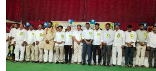
ప్రజావాణి జిల్లా ప్రతినీధి పెద్దపల్లి మార్చి 29వ తేదీన జిల్లా కేంద్రంలో రెడ్డి ఫంక్షన్ హాల్ లో గౌడ సంఘం ఆధ్వర్యంలో గౌడ ప్రజా ప్రతినిధులకు, గౌడ జర్నలిస్టులకు ఆత్మీయ సన్మాన కార్యక్రమాన్ని నిర్వహించారు గౌడ సంఘం ప్రతికర 2025-26

సంవత్సరంలో గెలుపొందిన ప్రజాప్రతినిధులకు ఆత్మీయ సన్మాన కార్యక్రమాలు నిర్వహించి ప్రజా ప్రతినిధులను, జర్నలిస్టులను, ఘనంగా సత్కరించుకున్నారని అనంతరం పెద్దపల్లి గ్రంథాలయ వైరల్ అంతటి అన్నయ్య గౌడ మాట్లాడుతూ... గౌడ సంఘం అంటేనే కష్టాన్ని సమ్మకుని ప్రతి ఒక్కరికి సహాయం చేయడం ముందుండే మన సంఘం నివేదిత సంఘాలుగా విడిపోయి మనం బహుమత్తు లోపం వల్ల మనమే చోటా మనకు నష్టం జరుగుతుందని మనమంతా బకవత్తుగా ఒకే సంఘం గా ఉండి గౌడ కులస్తులందరికీ న్యాయం జరిగేలా మనం ముందుండి నడిచాలని ఆర్థికంగా రాజకీయంగా ఎదిగినప్పుడే మన ఆప్టిస్మాన్ని మనం కాపాడుకుంటాం కాబట్టి మనం మన పిల్లలందరినీ ఉన్నతంగా చదివిస్తూ నాయకుడిగా తయారు చేస్తూ మన ముందుకు సాగాలని పిలుపునిచ్చారు. ఈ కార్యక్రమంలో జిల్లా గౌడ సంఘం నాయకులు గౌడ సర్పంచులు ఉప సర్పంచులు కౌన్సిలర్లు ప్రజాప్రతినిధులు గౌడ డ్రైవ్ అండ్ ఎలక్ట్రానిక్ మీడియా పాల్గొన్నారు..