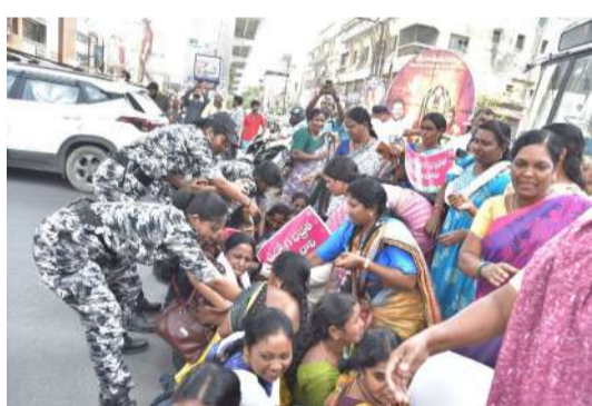
వేల రూపాయలు ఇవ్వాలని పీఎఫ్ ఈఎన్ఐ కల్పించాలని ఎక్కడైతే ఖాళీ ఉన్న ఏరియోలో అక్కడ ఆశ వర్షం ఫిలమ్ చేయాలని