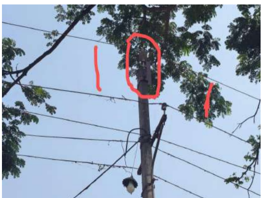
పెండింగ్లో ఉన్న సమస్యను వార్తా కథనం ద్వారా వెలుగులోకి తెచ్చి పరిష్కారానికి కృషి చేసిన ప్రజావాణి పత్రికా యాజమాన్యానికి అమీనాబాద్ గ్రామస్థులు కృతజ్ఞతలు తెలిపారు.