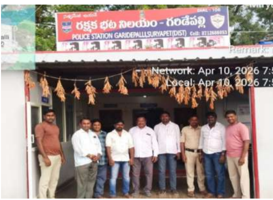
అత్యధిక జనాభా కలిగిన ముదిరాజులను రాజకీయంగా, ఆర్థికంగా ప్రభుత్వం చిన్నచూపు చూస్తోంది. విద్య, ఉద్యోగంలో తగిన ప్రాధాన్యత కల్పించకపోవడం వల్ల మా బిడ్డల భవిష్యత్తు

గండపల్లి ప్రజావాణి ఏప్రిల్ 10: కాంగ్రెస్ ప్రభుత్వం అధికారంలోకి వచ్చి రెండేళ్లు గడిచినా, ముదిరాజులను బీసీ-డీ (బీజ-బి) నుండి బీసీ-ఎ (బీజూ)లోకి చేరుస్తామన్న ఎన్నికల హామీని తుంగలో తొక్కడం అన్యాయం. ఈరోజు గాంధీ భవన్ ముట్టడికి పిలుపునిచ్చిన ముదిరాజ్ నాయకులను, కార్యకర్తలను రాష్ట్రవ్యాప్తంగా ముందస్తు అరెస్టులు చేయడాన్ని తీవ్రంగా ఖండిస్తున్నాం. హక్కుల కోసం పోరాడుతుంటే అక్రమ అరెస్టులతో అణిచివేయాలని చూడటం ప్రజాస్వామ్యాన్ని ఖానీ చేయడమే. మాట తప్పిన కాంగ్రెస్:లి ఎన్నికల మేనిఫెస్టోలో ముదిరాజుల పరికరణ మార్పుపై ఇచ్చిన హామీ కేవలం ఓట్ల కోసమేనా? రెండు ఏళ్లు దాటినా ఈ దిశగా ఒక్క అడుగు కూడా ముందుకు పడకపోవడం ముదిరాజ్ సమాజాన్ని వంచించడమే. లిజిటిమేట్ ధోరణి:లి తమ న్యాయమైన డిమాండ్ కోసం శాంతియుతంగా నిరసన తెలపడానికి వెళ్తున్న వారిని అర్ధరాత్రి నుంచి ఇళ్లలోనే గృహనిర్బంధం చేయడం, పోలీస్ స్టేషన్లకు తరలించడం ప్రభుత్వ పిరికిపంద చర్య. లిరాజకీయ, ఆర్థిక వివక్షల తిలంగాణలో