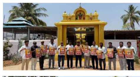
జమ్మికుంట ఏప్రిల్ 12: ప్రజావాణి: రాష్ట్రీయ స్వయంసేవక్ సంఘ అధ్యక్షులలో దశాబ్ది ఉత్సవాల సందర్భంగా ఈనెల 21వ తేదీ మంగళవారం పెద్ద పాపయ్య వల్లె ఉప మండల కేంద్రంలో పెద్ద పాపయ్య వల్లె చిన్న పాపయ్య వల్లె ఉప్పల్ సర్పింగాపూర్ దమ్మక పేట కాలనల్ల 5 గ్రామాలతో నిర్వహించబోయే కేసీ క్యాంప్ శ్రీశ్రీ వెంకటేశ్వర స్వామి దేవాలయం ఆవరణలో హిందూ సమ్మేళనం నిర్వహించడం జరుగుతుంది కావున కుటుంబ సమేతంగా పాల్గొని విజయవంతం చేయాలని