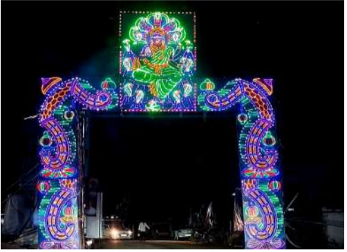
షాబాద్/ఏప్రిల్: 19 ప్రజావాణి: షాబాద్ మండలంలోని అంతిరెడ్డిగూడ గ్రామంలో ఆదివారం