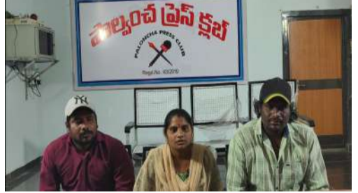
అక్రమ ఇసుక రవాణా చేస్తున్న అక్రమ ఇసుక ట్రాక్టర్లు పాల్వంచ రూరల్ పోలీస్ లు ట్రాక్టర్ పోలీస్ స్టేషన్ కు తరలించారు. అంతేకాకుండా అక్రమ ఇసుక రవాణా చేస్తూ మా గ్రామ పంచాయతీ రావలసిన ఆదాయాన్ని గండి కొడుతున్నారు. ఇందిరమంత్రి ఇండ్ల పేరుపై, ఒకరిద్దరి లబ్ధిదారులతో కుమ్మక్కై ఇసుకను అక్రమకర్తలకు కుప్పలు కుప్పలు దంపింగ్ చేసి, అర్రరాతిలు ట్రాక్టర్ల ద్వారా జగన్నాధపురం, ఇందిరానగర్ కాలనీ, పాల్వంచ వంటి పట్టణాలకు అక్రమ ఇసుకను తరలించి, ఒక ట్రాక్టర్ ఇసుకను 4,000 నుండి 5000 వరకు అమ్ముకుంటు