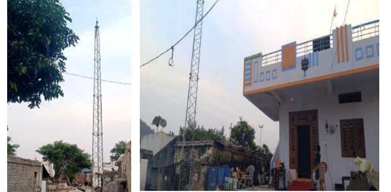
మన సమర్థ ప్రజావాణి పాలమూరు : మూసాపేట మండలం దాసరిపల్లి గ్రామంలోని నిరుపయోగంగా తుప్పు పట్టి ఉన్న టెలిఫోన్ టవర్ తో చుట్టూపక్కల నివాసులను ప్రజల ఇళ్లపై అధికారులకు ఎన్నిసార్లు మొరపెట్టుకున్న పద్ధితులతో పరిస్థితి సూతన పాలకవర్షాలైన ఈ సమస్యకు పరిష్కారం చూపి ప్రజల ప్రాణాలకు హామీ ఇవ్వాలని కోరుతూ తమ ఇళ్లపై కూలితే భారీ ఆస్తి నష్టం జరిగే ప్రమాదం ఉందని దీనిని గుర్తించి అధికారులు దీనిపై చర్యలు తీసుకొని తొలగించాలని దసరా పల్లి గ్రామ ప్రజలు డిమాండ్ చేస్తున్నారు.....