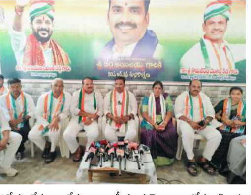
ఉద్దేశం లేకుండా కేవలం రాజకీయ ప్రయోజనాల కోసం బిల్లును వాడుకుంటున్న విధానం నిన్ను తేట తెల్లమైంది. ప్రధాన మంత్రి నరేంద్ర మోడీ వ్యాఖ్యలే ఈ విషయాన్ని బయటపెట్టాయి. బిల్లు ఆమోదం పొందకపోయినా తమకు నష్టం లేదని చెప్పడం వారి అసలు ఉద్దేశ్యాన్ని వెల్లడిస్తుంది. దక్షిణాది రాష్ట్రాలను బలహీనపరచే ప్రయత్నాలను ప్రజలు గట్టిగా తిప్పికొడుతున్నారు. ఈ నేపథ్యంలో 'ఇండియా' కూటమి దేశాన్ని రక్షించే శక్తిగా నిలుస్తోంది. భవిష్యత్లో కూడా ప్రజాస్వామ్యాన్ని కాపాడటానికి, చిన్న రాష్ట్రాల హక్కులను రక్షించడానికి మా 'ఇండియా' కూటమి పోరాటం కొనసాగుతుందన్నారు.