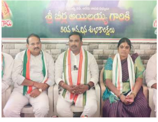
చేస్తే కాంగ్రెస్ పార్టీ మద్దతిస్తుంది. బిజెపి పార్టీ ప్రవేశ పెట్టిన మూడు బిల్లులో మహిళా అంశం లేదు. డివిజన్ బిల్లుతో మళ్ళీ అధికారం లోకి రావడం కోసం ప్రయత్నం చేస్తున్న భారతీయ జనతా పార్టీ.. మహిళా లోకానికి భారతీయ జనతా పార్టీ బేషరతుగా క్షమాపణ చెప్పాలి. రాజకీయ అవసరాల కోసం, రాజకీయ ఎత్తుగడల కోసం మహిళలని అడ్డం పెట్టుకొని రాజకీయాలు చేయాలనుకుంటే భవిష్యత్లో భారతీయ జనతా పార్టీకి మనుగడ ఉండదు. మహిళా రిజర్వేషన్ బిల్లుపై కూడా బిజెపి వైఖరి స్పష్టంగా లేదు. ఈ బిల్లు విషయంలో బిజెపి ద్వంద్వనీతి కనిపిస్తుంది. మహిళా బిల్లును అమలు చేయాలనే

యాదాద్రి భువనగిరి జిల్లా మన ప్రజావాణి జిల్లా ప్రతినిధి ఏప్రిల్ 19 పార్లమెంట్లో మహిళా రిజర్వేషన్ బిల్ (131వ రాజ్యాంగ సవరణ) మునుగులో దేశ సమాఖ్య స్వరూపాన్ని దృఢీకరించాలని చూసిన మోడీ, అమిత్ షా కుటుంబం కాంగ్రెస్ పార్టీ రాహుల్ గాంధీ, ఖర్గే నాయకత్వంలో పటాపంచలు చేసినందు ప్రభుత్వ బిల్ అలేరు శాసనసభ్యులు బిల్ల అయిలయ్య యాదగిరిగుట్ట లో ఏర్పాటు చేసిన మీడియా సమావేశంలో పాల్గొని మాట్లాడారు. ఒకవేళ పార్లమెంట్లో బిల్లు నెగిలే బిజెపి తమ ఘనతగా, ఓడిపోతే ప్రతిపక్షాలను టార్గెట్ చేస్తామని కుట్ర వేస్తుంది. గతంలో ఇలాగే 2020లో రైతులపై నల్ల చట్టాలు తెచ్చామని ప్రజలను వచ్చిన తీవ్ర వ్యతిరేకతతో బిజెపి బొక్క బొక్క బోధ చేసింది. తెలంగాణ రాష్ట్రం తరఫున, దక్షిణాది రాష్ట్రాల బిల్లుల కోసం కృషి చేస్తున్న రేవంత్ రెడ్డికి మనస్ఫూర్తిగా ధన్య వాదాలు తెలియజేస్తున్నాం. 2024లో రాజ్యాంగాన్ని మార్చి రిజర్వేషన్లు ఎత్తేలామని, బలహీన వర్గాలను దృఢీకరించాలని కుట్ర వేస్తుంది. దేశంలో కాంగ్రెస్ పార్టీ, రాహుల్ గాంధీ ఉన్నంత వరకు బిజెపి అటలు సాగవు. మోడీకి కొంటోనోనో మొదలైంది. దక్షిణాది రాష్ట్రాలకు మోడీ అన్యాయం చేయాలని చూస్తుంటే, రాహుల్ గాంధీ ముఖ్యమంత్రి రేవంత్ రెడ్డి గట్టిగా నిలబడి ఈ రోజు బిల్లును ఆడ్డు కోవడం గొప్ప విషయం. ఇప్పుడున్న 543 సీట్లతో మహిళా రిజర్వేషన్ అమలు