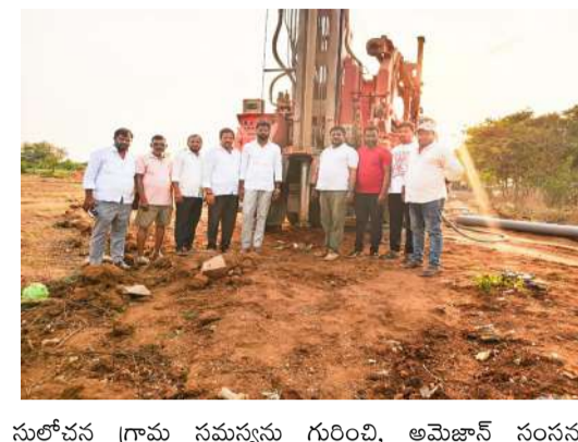
సులోచన గ్రామ సమస్యను గుర్తించి, అమెజాన్ సంస్థను

షాబాద్, ఏప్రిల్ 20( ప్రజావాణి)షాబాద్ మండల పరిధిలోని పెద్ద వేడు గ్రామంలో దీర్ఘకాలంగా కొనసాగుతున్న త్రాగునీటి సమస్యకు పరిష్కారం దిశగా కీలక ముందడుగు పడింది. గ్రామ సర్పంచ్ ఆధ్వర్యంలో, ప్రముఖ ఈ-కామర్స్ సంస్థ అమెజాన్ సహకారంతో సోమవారం అంగన్నాడి, ప్రాథమిక పాఠశాల అవరణలో కొత్త బోరు తవ్వించారు. గ్రామస్తులు గత కొన్నేళ్లుగా తీవ్ర నీటి కొరతతో ఇబ్బందులు పడుతున్నారు. ముఖ్యంగా వేసవి కాలంలో పరిస్థితి మరింత విషమంగా మారేది. ఈ సేవధ్యంలో సర్పంచ్ రాజ