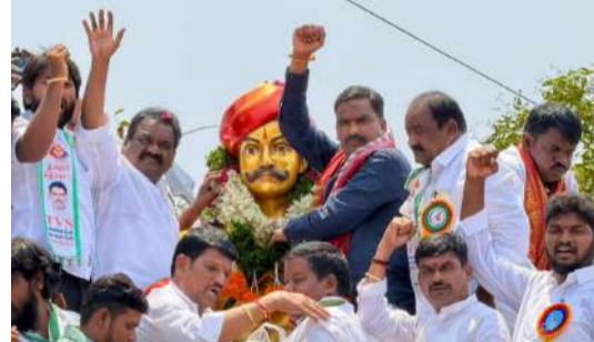
తెలిపారు. ప్రజల అవసరాల మేరకు మరిన్ని అభివృద్ధి పనులు చేపడతామని హామీ ఇచ్చారు.