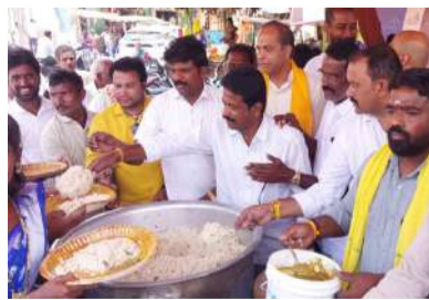
భారీ కేక్ కటింగ్ కార్యక్రమం నిర్వహించారు. అనంతరం కేక్ను ప్రజలకు పంచిపెట్టి, ప్రత్యేకంగా ఏర్పాటు చేసిన అన్నదాన శిబిరం ద్వారా వందలాది మందికి భోజనాన్ని పంపిణీ చేశారు. ఈ సందర్భంగా పలువురు నాయకులు మాట్లాడుతూ ముఖ్యమంత్రి చంద్రబాబు నాయుడు రాష్ట్ర అభివృద్ధికి చేసిన కృషి విశేషమని, ఆయన ప్రవేశపెట్టిన పథకాలు ప్రజలకు ఎంతగానో ఉపయోగపడుతున్నాయని కొనియాడారు. రాష్ట్రాన్ని అభివృద్ధి పథంలో ముందుకు నడిపిస్తున్న దూరదృష్టి గల నాయకుడిగా అభివర్ణించారు. ఈ కార్యక్రమాల్లో మండల నాయకులు, కార్యకర్తలు, అభిమానులు పెద్ద సంఖ్యలో పాల్గొని వేడుకలను విజయవంతం చేశారు.