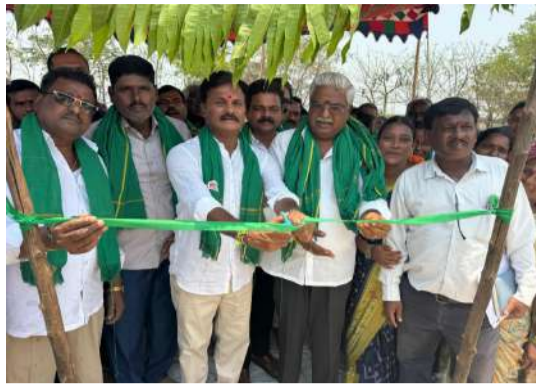
అందించేందుకు వడ్లపై క్వింటాల్కు రూ. 500 బోనస్ అందిస్తున్నామని వెల్లడించారు. ఈ చర్య రైతుల ఆర్థిక స్థితిని బలోపేతం చేస్తుంది అన్నారు. కొనుగోలు కేంద్రాలలో గిన్నీ బ్యాగులు, తూకం యంత్రాలు, మాయిశ్చరీ మీటర్లు సమృద్ధిగా అందుబాటులో ఉంచాలని, ధాన్యం తమ శాతం పరీక్షలు సక్రమంగా నిర్వహించాలని అధికారులకు ఆదేశించారు. రైతులు కేంద్రాలకు తీసుకు వచ్చే ధాన్యాన్ని ఆలస్యం లేకుండా వెంటనే