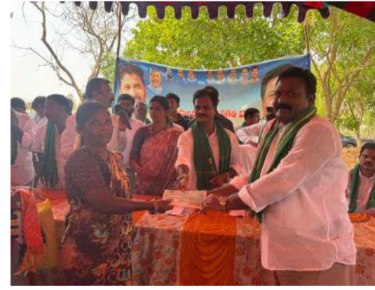
ప్రభుత్వం అందిస్తున్న సంక్షేమ పథకాలు చేరేలా అధికారులు కృషి చేయాలని ఎమ్మెల్యే సూచించారు. ఈ కార్యక్రమంలో మండల ప్రజాప్రతినిధులు, గ్రామ సర్పంచులు, సీనియర్ నాయకులు, పార్టీ కార్యకర్తలు లబ్ధిదారులు పాల్గొన్నారు