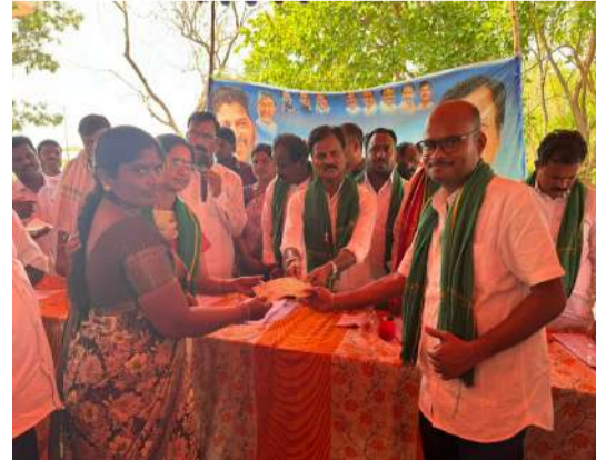
తగ్గించేందుకు కళ్యాణ లక్ష్మి, షాదీ ముబారక్ పథకాలు ఎంతో ఉపయోగపడు తున్నాయని, అలాగే అత్యవసర పరిస్థితుల్లో సిఎంఆర్ఎఫ్ ద్వారా ఆర్థిక సహాయం అందించడం ప్రజలకు ఉపశమనం కలిగిస్తోందని పేర్కొన్నారు. అరులైన ప్రతి ఒక్కరికి