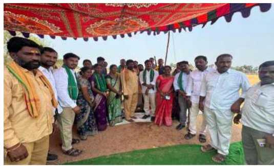
కొనుగోలు చేసి, చెల్లింపులు సమయానికి జరిగేలా చర్యలు తీసుకోవాలని సూచించారు. అదేవిధంగా కేంద్రాల వద్ద తాగునీరు, ఇతర కనీస సదుపాయాలు కల్పించాలని, రైతులకు ఎటువంటి ఇబ్బందులు తలెత్తకుండా ప్రత్యేక క్రెడెట్ పెట్టాలని తెలిపారు. రైతుల నుంచి వచ్చే ఫిర్యాదులను వెంటనే పరిష్కరించాలని, బాధ్యతా యుతంగా వ్యవహరించాలని అధికారులకు సూచించారు. ఈ కార్యక్రమంలో వ్యవసాయ శాఖ అధికారులు, మండల, గ్రామాల ప్రజాప్రతినిధులు, నాయకులు, ఐకేపీ ప్రతి నిధులు, రైతులు పెద్ద సంఖ్యలో పాల్గొన్నారు.