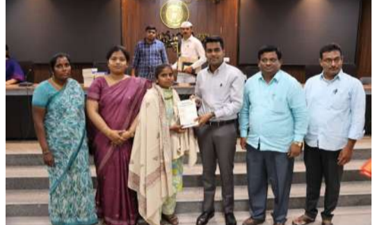
తెలిపారు. ఒకసారి విజయం సాధించిన తరువాత అక్కడే ఆగిపోకుండా ఇంకా ఉన్నత స్థాయికి ఎదగడానికి ప్రయత్నించాలన్నారు. విద్యార్థులు ఎల్లప్పుడూ మంచి పరిజ్ఞానాన్ని సాధించే దిశగా కృషి చేస్తే విజయం సహజంగా వస్తుందని, వైఫల్యాలు మనల్ని అవకాశదని చెప్పారు. జీవితం అనేది సహజంగా నిండినది, వాటిని ఎలా అధిగమిస్తామన్నదే ముఖ్యమని పేర్కొన్నారు. కష్టాల ద్వారా వచ్చిన ఫలితాలు మరింత విలువైనవని తెలిపారు. జీవితంలో అవకాశాలు ఎప్పుడూ ఉంటాయని, ఒక అవకాశం కోల్పోయినా మరో అవకాశం వస్తుందని, విద్యార్థులు తమ లక్ష్యాల సాధనలో వట్టుదగా ఉండాలని సూచించారు. అర్థంకలు, వైఫల్యాలను పాఠాలుగా తీసుకుని ముందుకు సాగాలని అన్నారు. ప్రస్తుతం ఆర్థికంగా ఇంటింటి వల్ల విద్యను నేర్చుకోవడం సులభమైందని, సోషల్ మీడియా, రీల్స్ వంటి వాటికి దూరంగా ఉండాలని సూచించారు. ఇంటర్నెట్ సానుకూలంగా వినియోగిస్తూ కొత్త విషయాలను నేర్చుకోవాలని, ప్రపంచంలో జరుగుతున్న మార్పులను నిరంతరం తెలుసుకుంటూ ఉండాలని చెప్పారు. విద్యార్థులు పుస్తకాలు