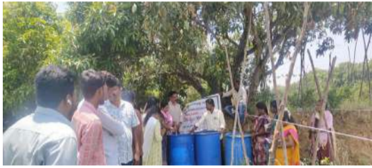
పెరుగుతాయని తెలిపారు. ఇక అర్హతపూర్వకంగా గోతుల పద్ధతి ద్వారా వర్షపు నీటిని సేకరించి నేలలోకి చొరబాటును పెంచి మొక్కల వేర్లకు తగిన తేమ అందించవచ్చని చెప్పారు. తక్కువ వర్షపాతం ఉన్న ప్రాంతాల్లో ఈ విధానం పంటల పెరుగుదలకు తోడ్పడుతుందని పేర్కొన్నారు. ఈ కార్యక్రమంలో రైతు సేవా కేంద్ర సిబ్బంది, వ్యవసాయ సిబ్బంది పాల్గొన్నారు.