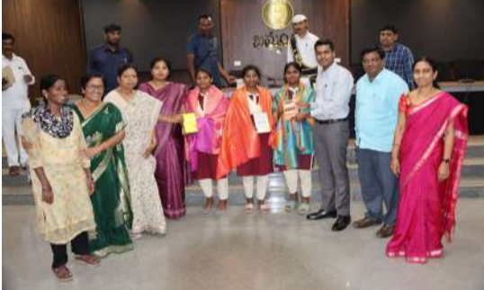
చదవడం అలవాటు చేసుకోవాలని, ప్రతి నెల ఒక కొత్త పుస్తకం చదివే లక్ష్యాన్ని పెట్టుకోవాలని సూచించారు. చదివిన విషయాలను రాసుకునే అలవాటు పెంచుకోవాలని తెలిపారు. ఈ సందర్భంగా తల్లిదండ్రులు, ఉపాధ్యాయులు, విద్యార్థులకు అభినందనలు తెలిపారు. ఈ సందర్భంగా విద్యార్థులు మాట్లాడుతూ కాలేజీలో నిర్వహించిన ప్రత్యేక తరగతులు తమ సందేశాలను నిచ్చి చేసుకోవడంలో ఎంతో సహాయం పడ్డాయని తెలిపారు. ఆ తరగతుల వల్ల పరీక్షల్లో మంచి ఫలితాలు సాధించగలిగామని పేర్కొన్నారు. అలాగే, ఇంటర్మీడియట్ పరీక్షల్లో మంచి మార్కులు సాధించేందుకు సహకరించిన జిల్లా యంత్రాంగం, లెక్కరద్దకు కృతజ్ఞతలు తెలిపారు. అనంతరం జిల్లా కలెక్టర్, అధ్యక్షుల ప్రభుత్వ విద్యార్థిని, విద్యార్థులను ఘనంగా సన్మానించారు. ఈ కార్యక్రమంలో జిల్లా ఇంటర్మీడియట్ అధికారి కే. రవిబాబు, కె.జి.వి. సోషల్ వెల్ఫేర్, ట్రైబల్ వెల్ఫేర్, షిస్ వెల్ఫేర్, ఆర్డీసీ, స్కూల్ ఆఫ్ ఎక్సలెన్స్, అలబేర్డర్ కళాశాల, మోడల్ కాలేజీ ఎన్.ఓ.లు, సంబంధిత అధికారులు, విద్యార్థిని, విద్యార్థులు, తల్లిదండ్రులు తదితరులు పాల్గొన్నారు.