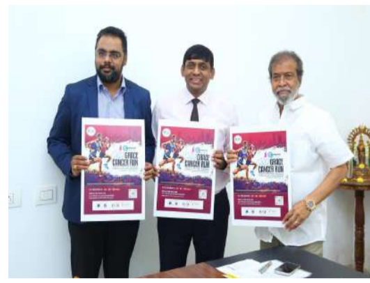
ఆధ్వర్యంలో ప్రపంచవ్యాప్తంగా 130 దేశాలలో క్యాన్సర్ అవేర్నెస్

మన ప్రజావాణి, అందోలు ప్రతినది: రాష్ట్ర వైద్య, ఆరోగ్య శాఖ మంత్రి దామోదర్ రాజనర్సింహ హైదరాబాద్ లోని తన నివాసంలో గ్రేస్ ఫౌండేషన్ ఆధ్వర్యంలో క్యాన్సర్ అవేర్నెస్ డ్రైవ్ రన్ పై రూపొందించిన వాల్ పోస్టర్ ను ఆవిష్కరించారు. ఈ సందర్భంగా క్యాన్సర్ నివారణ, అవగాహన పై ప్రపంచవ్యాప్తంగా సుమారు 130 దేశాలలో చేపట్టిన 'వరల్డ్ లాక్స్ క్యాన్సర్ అవేర్నెస్ డ్రైవ్ రన్' కోసం చేపట్టిన అవేర్నెస్ రన్ కార్యక్రమం గురించి నిర్వాహకులు మంత్రికి వివరించారు. గ్రేబల్ గ్రేస్ క్యాన్సర్ రన్ ను హైదరాబాద్లోని గచ్చిబౌలి స్టేడియంలో ఆక్టోబర్ నెల 11వ తేదీ 2026 న ఘనంగా నిర్వహించబోతున్నట్లు వారు తెలిపారు. గత సంవత్సరం గచ్చిబౌలి స్టేడియంలో నిర్వహించిన గ్లోబల్ గ్రేస్ క్యాన్సర్ రన్ లో సుమారు 35 వేల మంది, 130 దేశాలలో సుమారు 3 లక్షల మందికి పైగా క్యాన్సర్ అవేర్నెస్ రన్ లో పాల్గొన్నారు వారు మంత్రికి తెలిపిజేశారు. గ్రేస్ ఫౌండేషన్