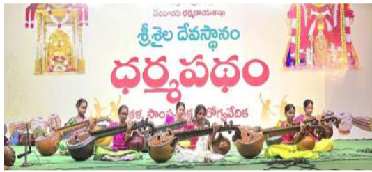
పలుగీతాలు, అష్టకాలు మొదలైనవాటిని ఆలాపించున్నారు.

నంద్యాల జిల్లా శ్రీశైలం ఏప్రిల్ 25 (ప్రజావాణి): దేవస్థానము నిర్వహిస్తున్న ధర్మసభలో భాగంగా (నిత్యకళారాధన కార్యక్రమంలో భాగంగా) ఈరోజు (25.04.2026) కవచి కృపాసాధన వీణా బ్యాండ్ రియల్, హైదరాబాద్ వారిచే వీణనాదం కార్యక్రమం ఏర్పాటు చేయబడింది. ఆలయ దక్షిణ మాడవీధిలోని నిత్యకళారాధన వేదిక వద్ద ఈ రోజు సాయంకాలం నుండి ఈ వీణనాదకార్యక్రమం ఏర్పాటు చేయబడింది. ఈ కార్యక్రమంలో వక్రతుండమహాకాయ, శివతాండవం, భో... శంభో, ముదాకారతాండవం, శివాష్టకం, శివస్తోత్రం మొదలైన