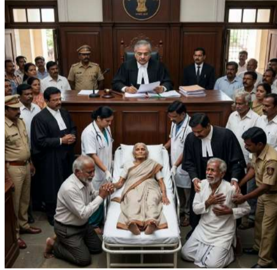
వారికి ఆస్తి, పాస్సులు కూడ ఎక్కువ లేవు. కేసు పూర్వరాలు ఏమిటంటే తన అన్న వద్ద తల్లి వయసు 110 (సం.రాలు) గత 40 సం.రాలుగా ఉంటుంది. అలనా, పాలన, మంచి, చెడు అన్ని

భద్రాద్రి జిల్లా బ్యారో/మన ప్రజావాణి (ఏప్రిల్ 25): హైకోర్ట్ విచిత్రమైన ఒక కేసు, కలిసంటే కలదునుఖం, అన్నదమ్ములు అంటే రామలక్ష్మణుడుల ఉండాలి అని అంటారు. కదా మరి ఈ కేసు వివరాలు తెలుసుకుందాం. ఇటీవల హైకోర్ట్ లో ఒక కేసు బెంచ్ ముందుకొచ్చింది. జడ్జి కేసు చదువుతుండగా కేసు వేసిన వారు అన్న దమ్ములు. అన్న వయస్సు 80 సంవత్సరాలు, తమ్ముని వయస్సు 70 సంవత్సరాలు. బహుశా ఇది ఆస్తికి సంబంధించిన కేసు ఏమో! ఇంత పెద్ద వయస్సులో వీరికి ఆస్తి ఎందుకో అనుకుంటూ, కేసు పూర్తిగా చదివాకా జడ్జికి దిమ్మ దిరిగి కంఠు తిన్నాడు. ఇంత వరకు ఇటువంటి కేసు తన ముందుకు రాలేదు.