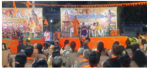
ఆధ్వర్యంలో శనివారం సాయంత్రం అంగరంగ వైభవంగా

జమ్మికుంట ఏప్రిల్ 25 (ప్రజావాణి): జమ్మికుంట పట్టణంలోని శ్రీ విశ్వేశ్వర స్వామి దేవస్థానం ఆవరణలో హిందూ ధర్మ సమ్మేళనం