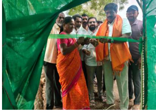
పలువురు అభిప్రాయపడ్డారు. ప్రజల ఆరోగ్యం దృష్ట్యా పరిశుభ్రమైన నీరు అందించడం ముఖ్యమని, భవిష్యత్తులో కూడా ఇలాంటి కార్యక్రమాలు కొనసాగిస్తామని నాయకులు హామీ ఇచ్చారు. ఈ కార్యక్రమంలో పడమటి తండా గ్రామ సర్పంచ్