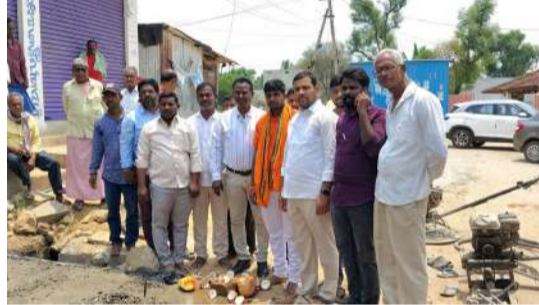
చేశారు. సిసి రోడ్డు వేయడంతో వాహనాల రాకపోకలకు ఇబ్బంది లేకుండా ఉంటుందని. గతంలో ఇరుకైన రహదారి ఉండడం వలన రాకపోకలకు తీవ్ర ఇబ్బంది ఉండేది. అయితే ఇట్టేలకు ఎన్ఆర్ఈజీఎస్ ద్వారా అందర్ గ్రాండ్ డ్రైనేజీ, సిసి రోడ్డు వేయడంతో రోడ్డు విస్తరణ జరుగుతుండడంతో రాయపోల్ మండల కేంద్రానికి కొత్తదనం వచ్చిందని వారు పేర్కొన్నారు. ఈ రోడ్డు నిర్మాణానికి నిధులు మంజూరు చేసిన ఎంపీ రఘునందన్