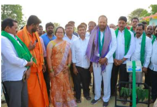
కొనుగోళ్ల విషయంలో ఎలాంటి ఇబ్బందులు తలెత్తకుండా చర్యలు తీసుకుంటుందని స్పష్టం చేశారు. రైతులు ప్రభుత్వం నుంచిన విధంగా ధాన్యానికి 15 శాతం తేమ ఉండేలా చూసుకోవాలని కోరారు. వర్షాలు వచ్చినా ఇబ్బందులు లేకుండా ముందస్తు చర్యలు తీసుకోవాలని అధికారులను ఆదేశించారు. అలాగే, వివిధ రకాల ధాన్యాల రేట్లను సూచించే పబ్లిక్ ప్రైవేట్ కేంద్రాల్లో ఏర్పాటు చేయాలని సూచించారు. పెద్దపల్లి నియోజకవర్గంలోని అన్ని