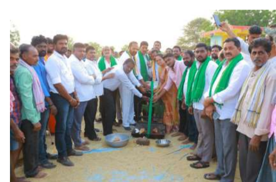
గ్రామాల్లో వడ్ల కొనుగోలు కేంద్రాలను ప్రారంభిస్తున్నామని, రైతులు వాటిని నడవించేలా చేసుకోవాలని కోరారు. కొనుగోలు కేంద్రాల్లో ఎలాంటి ఇబ్బందులు ఉండవని తెలిపారు. ఈ కార్యక్రమంలో మున్సిపల్ చైర్మన్, వ్యవసాయ మార్కెట్ చైర్మన్, డైరెక్టర్లు, పలు గ్రామాల సర్పంచులు, ఉపసర్పంచులు, కాంగ్రెస్ నాయకులు, కార్యకర్తలు, మాజీ ప్రజాప్రతినిధులు, రైతులు తదితరులు పాల్గొన్నారు.