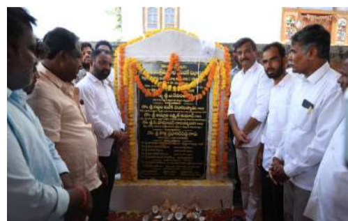
ఆదేశించారు. అలాగే గ్రామ అభివృద్ధికి అవసరమైన ప్రతి మౌలిక పనులను కల్పించేందుకు శాసన ఎల్లప్పుడూ అందుబాటులో

దుబ్బాక నియోజకవర్గం ప్రజావాణి 28 ఏప్రిల్ దుబ్బాక నియోజకవర్గ అభివృద్ధిలో భాగంగా చేగుంట మండలం కొత్త వాల్మీ తండాలో చేపట్టనున్న రోడ్డు నిర్మాణ పనులకు దుబ్బాక శాసనసభ్యులు కొత్త ప్రభాకర్ రెడ్డి గారు శంకుస్థాపన చేశారు. గ్రామ ప్రజలకు మెరుగైన రవాణా సౌకర్యాలు కల్పించడం, తండా అభివృద్ధిని వేగవంతం చేయడం లక్ష్యంగా ఈ పనులు చేపడుతున్నట్లు ఎమ్మెల్యే తెలిపారు. ఈ సందర్భంగా గ్రామస్థులతో ఎమ్మెల్యే ఆతీయంగా మాట్లాడి వారి సమస్యలను అడిగి తెలుసుకున్నారు. తండాలో నెలకొన్న పలు సమస్యలను గ్రామ ప్రజలు ఎమ్మెల్యే దృష్టికి తీసుకురాగా, వాటి పరిష్కారానికి తక్షణ చర్యలు తీసుకోవాలని సంబంధిత అధికారులకు సూచించారు. ముఖ్యంగా గ్రామంలో కొనసాగుతున్న డ్రైనేజీ పనులను త్వరితగతిన పూర్తి చేసి ప్రజలకు ఇబ్బందులు లేకుండా చూడాలని అధికారులను