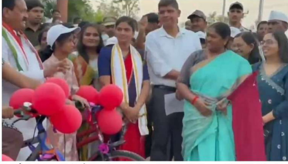
మంత్రి సీతక్క స్వయంగా మహిళలతో కలిసి అక్షరాలా దిద్దించి, కార్యక్రమాలు మహిళలు, బాలికల భవిష్యత్తును మరింత వారిలో ఉత్సాహాన్ని నింపారు. ప్రభుత్వం చేపడుతున్న ఈ బలోపేతం చేస్తాయని ఆమె పేర్కొన్నారు.

టీనేజ్ బాలికల సాధికారత కోసం రాష్ట్ర ప్రభుత్వం చేపట్టిన 'సేవ' సమూర్ ప్రోగ్రాంలో భాగంగా సైకిల్ రైడింగ్ శిక్షణ కార్యక్రమాన్ని మంత్రి సీతక్క ప్రారంభించారు. గ్రామీణ ప్రాంతాల బాలికలకు అత్యవసానం పెంపొందించడమే లక్ష్యంగా ఈ కార్యక్రమాన్ని నిర్వహిస్తున్నట్లు తెలిపారు. ఈ సందర్భంగా మంత్రి మాట్లాడుతూ భవిష్యత్తులో బాలికలు స్వతంత్రంగా ప్రయాణించేందుకు, బైక్ రైడింగ్ నేర్చుకునేందుకు ఇది తొలి అడుగుగా ఉపయోగపడుతుందని అన్నారు. సెర్చ్ ఆఫ్ఫీస్లో నిర్వహిస్తున్న ఈ సమూర్ ప్రోగ్రాంలో భాగంగా లైఫ్ స్కెల్ప్, ప్రాజెక్ట్ నైపుణ్యాలను బాలికలకు బోధిస్తున్నట్లు పేర్కొన్నారు. సైకిల్ రైడింగ్ శిక్షణతో పాటు బాలికల్లో ధైర్యం, అత్యుత్సాహం పెంపొందించడంపై ప్రత్యేక దృష్టి సాల్పిస్తుమని తెలిపారు. గ్రామ గ్రామాన ఈ తరహా శిక్షణ కార్యక్రమాలను విస్తరించాలని అధికారులు సూచించారు. ఇదే కార్యక్రమంలో భాగంగా 'అమృత ఆక్షరమాల' కార్యక్రమాన్ని కూడా మంత్రి ప్రారంభించారు. ఈ పథకం ద్వారా మహిళలకు అక్షరాస్యత కల్పిస్తూ చదవడం, రాయడం నేర్పుతున్నారని తెలిపారు. రాష్ట్రవ్యాప్తంగా సుమారు 12 లక్షల మహిళలకు విద్యాబోధన అందిస్తున్నట్లు వెల్లడించారు. మహిళల సాధికారతకు విద్య అత్యంత కీలకమని మంత్రి పేర్కొన్నారు. ప్రతి మహిళ అక్షరాస్యరాలిగా మారితే కుటుంబం, సమాజం అభివృద్ధి సాధ్యమవుతుందని అన్నారు. ఈ కార్యక్రమంలో