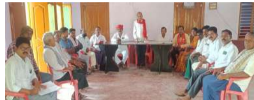
సాధించుకున్న 8 గంటల పని విధానాన్ని నేడు కేంద్రంలో బిజెపి ప్రభుత్వం అధికారంలోకి వచ్చిన తర్వాత కార్మికుల హక్కులను హరించి వేస్తూ 44 చట్టాలను నాలుగు రోజుల్లో గా విధించి 12 గంటల పనిని పొడిగిస్తూ కార్మికుల శ్రమను దోచివేసి తెరవేసారని మండిపడ్డారు. కార్మికోదేశ శక్తులను పెంచి పోషిస్తూ