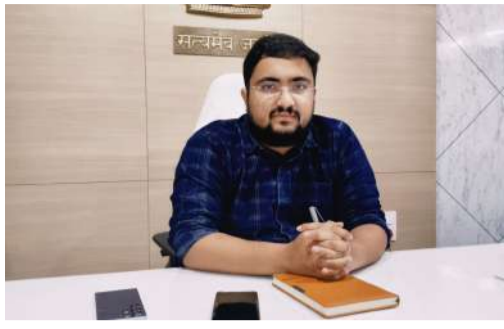
లో ఏదో ఒకటి ఎంచుకోవాలని అప్పుడే పునరావాసానికి ఎంత

ప్రజావాణి ప్రతినిధి కూనవరం మండలం ఏప్రిల్ 28: పోలవరం జిల్లా చింతూరు డివిజన్ కూనవరం మండలం పోలవరం ప్రాజెక్టు నిర్వాసితులకు వచ్చే ఏడాది ఫిబ్రవరి కల్లా ఆర్ అండ్ ఆర్ ప్యాకేజీ అమలు చేసి పునరావాసం కేంద్రాల్లో అన్ని సౌకర్య సదుపాయాలను కల్పిస్తామని అప్పటికల్లా ఖాళీ చేయిస్తామని చింతూరు ఐటీడిపి పీవో శుభం నోక్వార్ చెప్పారు. గిరిజనులకు ఇళ్లు నిర్మిస్తామని, 41.15 1 బి కాంటూరు లోని 32 గ్రామాల ప్రజలకు పునరావాసం పరిహారాలు అమలు చేయడం జరుగుతుందని, గిరిజనేతులకు నిర్వాసితులకు ఇల్లు నిర్మించుకు నేందుకు రూ 3.54 లక్షలు చెల్లిస్తామని ఇచ్చిన పోటీ నిర్వాసితులు ఇల్లు నిర్మించు కోకుంటే ఇచ్చిన సగదును రికవరీ చేస్తామని చెప్పారు. ఏ ఆర్ పురం మండల వాసులు ఈ నెల 30 కల్లా మూడు అప్పిన్