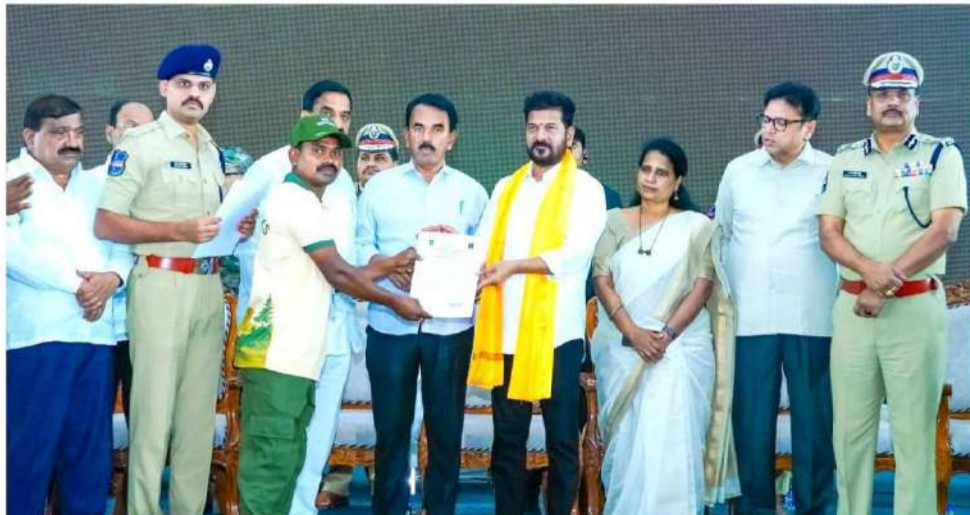
ముఖ్యమంత్రి సూచించారు. శిక్షణ కాలంలో వారికి స్కెల్ప్ సిబ్బంది సానుకూల ఫలితాలు ఇస్తుందని అధికారులు అభిప్రాయం వ్యక్తం చేస్తున్నారు.

గతంలో తీవ్రవాద ప్రభావం ఉన్న ప్రాంతాల్లో అభివృద్ధిని వేగవంతం చేయడమే కాకుండా గిరిజన యువతను సమాజంలో భాగస్వామ్యం చేయాలనే లక్ష్యంతో ఈ కార్యక్రమాన్ని చేపట్టినట్లు ప్రభుత్వం తెలిపింది. ఒకప్పుడు మావోయిస్టులకు దారి చూపిన యువకులు ఇకపై పర్యాటకులకు మార్గదర్శకులుగా మారడం ప్రత్యేకతగా నిలుస్తోంది. ఈ సందర్భంగా గిరిదర్శకులకు యంగ్ ఇండియా స్కెల్ప్ యూనివర్సిటీలో అరు నెలల పాటు సాఫ్ట్ స్కెల్ప్ శిక్షణ ఇవ్వాలని