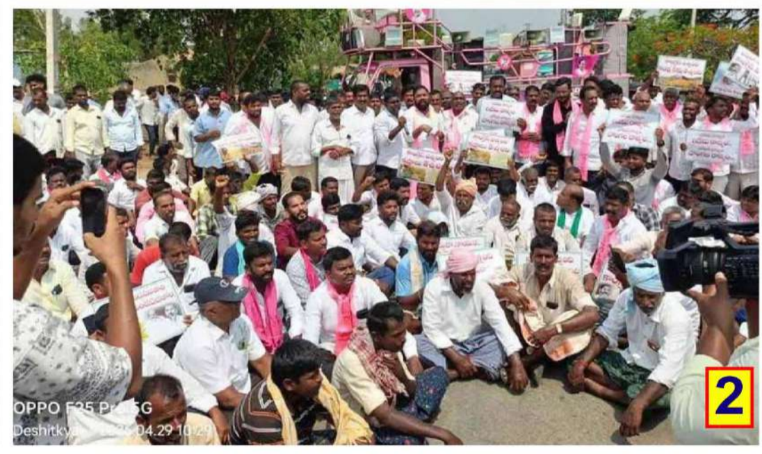
OPPO F25 Pro 5G Deshikty 2024.29.10.24

నాగర్ కర్నూల్ లో రైతుల రాస్తారోకో బీఆర్ఎస్ ఆధ్వర్యంలో భారీ నిరసన వర్షాలతో ధాన్యం తడిసి రైతులకు నష్టం వెంటనే కొనుగోలు చేయాలని డిమాండ్