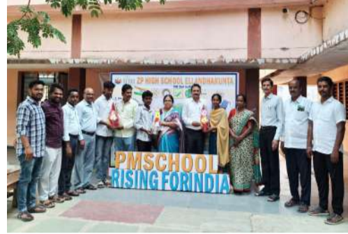
విద్యార్థులకు గాను 47 మంది విద్యార్థులు ఉత్తీర్ణత సాధించడం చాలా సంతోషంగా ఉందని, పాఠశాల నుండి 100% ఉత్తీర్ణత