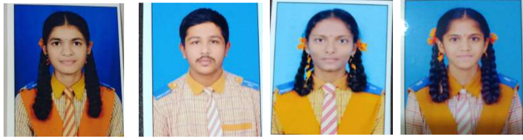
ఉపాధ్యాయుల అంకితభావం, తల్లిదండ్రుల సహకారమే ఈ విజయానికి కారణమని ఆయన పేర్కొన్నారు. విద్యార్థుల ఈ విశిష్ట