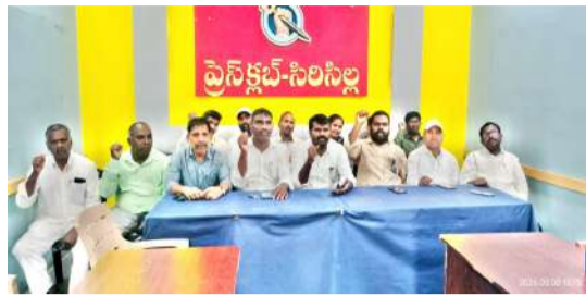
హాజరుకావాలని నిర్వాహకులు పిలుపునిచ్చారు. ఈ కార్యక్రమానికి ఎమ్మార్ఎస్ వ్యవస్థాపకుడు మందక్కష్ట మాదిగ ముఖ్య అతిథిగా విచ్చేయనున్నట్లు తెలిపారు. ఈ సందర్భంగా వారు మాట్లాడుతూ....జిల్లాలోని క్రైస్తవుల అందరూ కల, మత భేదాలు

లేకుండా సభకు హాజరై విజయవంతం చేయాలని నిర్వాహకులు కోరారు. ఎస్సీ, బీసీ, ఓసీ వర్గాలకు చెందిన క్రైస్తవులు ఉన్నప్పటికీ, ముఖ్యంగా ఎస్సీ క్రైస్తవులపైనే వివక్ష కొనసాగుతోందని ఆవేదన వ్యక్తం చేశారు.కొంతమంది మత కల్లోలాలను రెచ్చగొట్టే విధంగా వ్యవహరిస్తున్నారని ఆరోపించారు. దళిత క్రైస్తవుల హక్కులను కాపాడుకునేందుకు అందరూ ఐక్యంగా ముందుకు రావాల్సిన అవసరం ఉందన్నారు. కేంద్ర ప్రభుత్వం కావాలనే దళిత క్రైస్తవుల హక్కులను అణగదొక్కే కుట్ర చేస్తోందని విమర్శించారు.దళిత క్రైస్తవులకు వ్యతిరేకంగా సుప్రీంకోర్టు పరిధిలో వచ్చిన జివోలను రద్దు చేయాలని డిమాండ్ చేశారు. ఈ అంశంపై ఏ రాజకీయ పార్టీ నాయకుడు కూడా స్పందించకపోవడం బాధాకరమన్నారు. "మన హక్కులను మనమే కాపాడుకోవాలి. అందరం ఒక్కటిగా పోరాడుదాం" అని సభ నిర్వాహకులు పిలుపునిచ్చారు