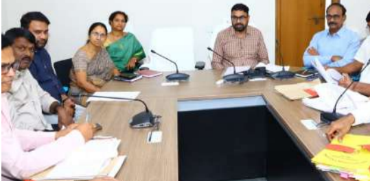
అధికారులకు సూచించారు. ముఖ్యంగా ఒక కార్యాలయం లేదా విభాగంలో 40 శాతం కంటే ఎక్కువ మంది ఉద్యోగులను బదిలీ