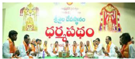
నంద్యాల జిల్లా శ్రీశైలం మే 21 (ప్రజావాణి)దేవస్థానము నిర్వహిస్తున్న ధర్మపథంలో భాగంగా (నిత్య కళారాధన కార్యక్రమంలో భాగంగా) ఈరోజు (21.05.2026) శ్రీ రఘురామ భజన మండలి, నంద్యాల వారిచే భజన కార్యక్రమం