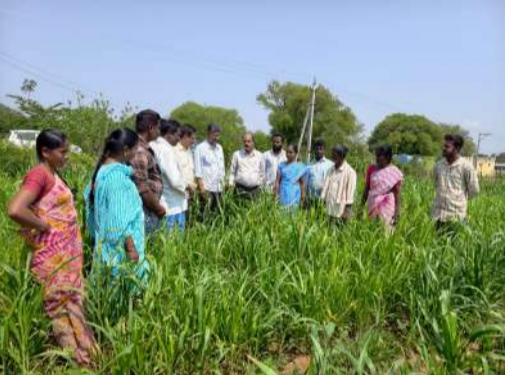
ఈ సందర్భంగా ఘన జీవామృతం, ద్రవ జీవామృతం తయారీ విధానాలు, పంటలపై పిచికారీ చేసేందుకు ఉపయోగించే వివిధ కాషాయాల తయారీ, వాటి వినియోగం తదితర అంశాలపై రైతులకు వివరించారు. అలాగే ప్రకృతి వ్యవసాయంలో అనుసరించాల్సిన పద్ధతులు, తక్కువ ఖర్చుతో అధిక నాణ్యత గల దిగుబడులు సాధించే మార్గాలను తెలియజేశారు. ఆనంతరం