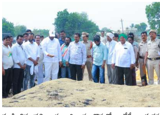
వండించిన ప్రతి ధాన్యం గింజను కొనుగోలు చేసే బాధ్యతను ప్రభుత్వం తీసుకుంటోందని పేర్కొన్నారు. గాంధీనగర్లో నష్టపోయిన రైతులకు అండగా నిలిచి, వారికి ఎల్లప్పుడూ తోడుగా ఉంటామని ఎమ్మెల్యే స్పష్టం చేశారు. ఈ కార్యక్రమంలో మున్సిపల్ చైర్మన్, స్థానిక కౌన్సిలర్లు, ప్రజాప్రతినిధులు, కాంగ్రెస్ నాయకులు, రైతులు తదితరులు పాల్గొన్నారు.