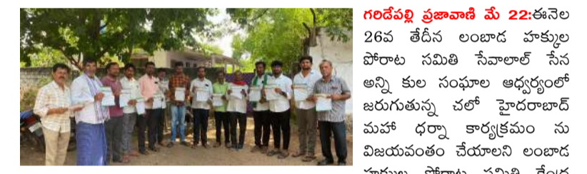
గరిడేపల్లి ప్రజావాణి మే 22: ఈనెల 26వ తేదీన లంబాడ హక్కుల పోరాట సమితి సేవాలాల్ సేన అన్ని కుల సంఘాల ఆధ్వర్యంలో జరుగుతున్న చలో హైదరాబాద్ మహా ధర్మా కార్యక్రమం ను విజయవంతం చేయాలని లంబాడ హక్కుల పోరాట సమితి కేంద్ర