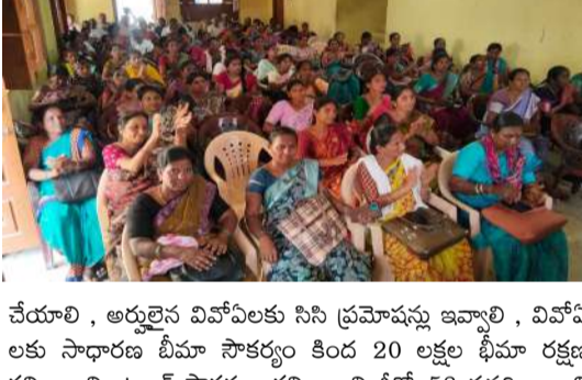
చేయాలి, అర్హులైన వివోపలకు సీని ప్రమోషన్లు ఇవ్వాలి, వివోపలకు సాధారణ బీమా సౌకర్యం కింద 20 లక్షల భీమా రక్షణ కల్పించాలి, ట్యూబ్ సౌకర్యం కల్పించాలి, జీవో 58 సవరించాలి రాష్ట్ర ప్రభుత్వాన్ని డిమాండ్ చేశారు. ప్రభుత్వం మా సమస్యలను అమలు చేయని యెడల రాష్ట్రవ్యాప్తంగా ఈ కాంతియుత నిరసన సమ్మెను మరింత ఉధృతం చేసి డి ఆర్ డి ఓ. జిల్లా కలెక్టర్ కార్యాలయం ముట్టడిస్తామని హెచ్చరించారు. ఈ కార్యక్రమంలో 8 మండలాల అధ్యక్షులు కార్యదర్శులతో పాటు సభ్యులు పాల్గొన్నారు.