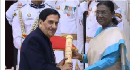
న్యూఢిల్లీ, మే 25: భారత రాష్ట్రపతి ద్రౌపది ముర్ము చేతుల మీదుగా ఢిల్లీలోని రాష్ట్రపతి భవన్ లో

సోమవారం పద్మ అవార్డుల ప్రధానోత్సవం ఘనంగా జరిగింది. దేశంలోని వివిధ రంగాల్లో విశిష్ట సేవలందించిన ప్రముఖులకు భారత ప్రభుత్వం.. దేశ అత్యున్నత పౌర పురస్కారాలైన పద్మవిభూషణ్, పద్మభూషణ్, పద్మశ్రీలను ప్రధానం చేసింది. ఈ ఏడాది మొత్తం 131 మందికి ఈ పురస్కారం దక్కగా.. వారిలో ఐదుగురు పద్మవిభూషణ్, 13 మంది పద్మభూషణ్, 113 మంది మిగతావారు..