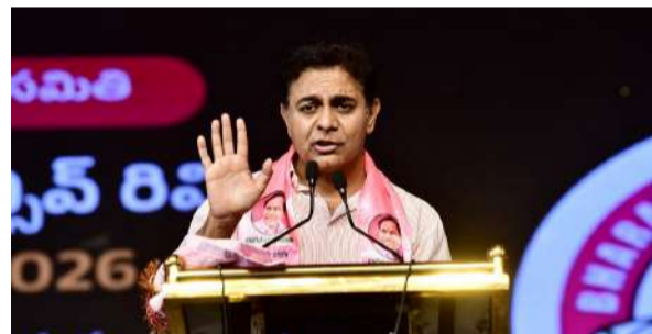
హైదరాబాద్, మే 25: బీఆర్ఎస్ అధికారం లోకి రాగానే హైదరాబాద్ సిటీలో 24 గంటల తాగునీటిని సరఫరా చేస్తామని మాజీమంత్రి కెటిఆర్ అన్నారు. 24 గంటల కరెంట్ ఇచ్చిన తీరుగానే ప్రతి ఇంటికి మంచి నీరు అందిస్తామని స్పష్టం చేశారు. తెలంగాణకు 24 గంటల కరెంట్ ఇచ్చింది కేసీఆర్ అని.. హైదరాబాద్ లో 24 గంటల తాగునీరు ఇచ్చేది కూడా కేసీఆర్ అని వెల్లడించారు. కాంగ్రెస్