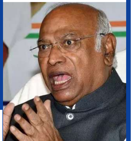
తగలబెట్టడానికి మోడీ ప్రభుత్వం పెట్రోల్ చల్లుతోందని విమర్శించారు. 2014లో రూ.71.41 ఉన్న లీటర్ పెట్రోల్ ధరను మోడీ సర్కారు 2026 నాటికి రూ.102.12కు చేర్చిందని ఎద్దేవా చేశారు. రెండు వారాల లోపే పెట్రోల్, మిగతా 2లో...

న్యూఢిల్లీ, మే 25 : శంలో రోజురోజుకు పెరుగుతోన్న ఇంధన ధరల పై కాంగ్రెస్ చీఫ్ మల్లికార్జున ఖర్గే ఆందోళన వ్యక్తం చేశారు. ఈ రోజువారీ డోపిడీ పల్ల ఎవరు లాభపడుతున్నారని ప్రశ్నించారు. సామాన్యుల పొదుపును