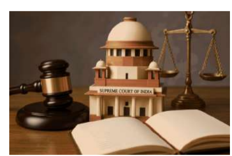
న్యూఢిల్లీ, మే 25 : దేశవ్యాప్తంగా రుమాం రేపిన నీట్ ప్రశ్నపత్రం లీక్ వ్యవహారంపై

సుప్రీంకోర్టు కీలక వ్యాఖ్యలు చేసింది. ఎన్ని ఆడేశాలు జారీ చేసినా.. గత పేపర్ లీక్ ఘటనల నుంచి నేషనల్ టెస్టింగ్ ఏజెన్సీ ఎలాంటి గుణపాఠాలు నేర్చుకోలేదని అత్యున్నత న్యాయస్థానం అసహనం వ్యక్తం చేసింది. ఈ వ్యవహారంపై ఎన్టీఎతో పాటు కేంద్రం, సీబీఐకి నోటీసులు జారీ చేసింది. ఈ ఏడాది మే 3వ తేదీన దేశవ్యాప్తంగా జరిగిన నీట్ యూజీ 2026 పరీక్షకు సంబంధించిన ప్రశ్నపత్రం లీకవడం